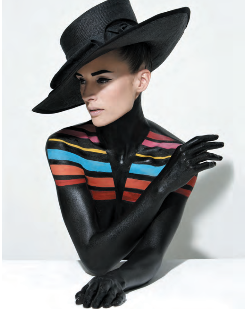
Body Painting réalisé pour la campagne publicitaire VIMUA.