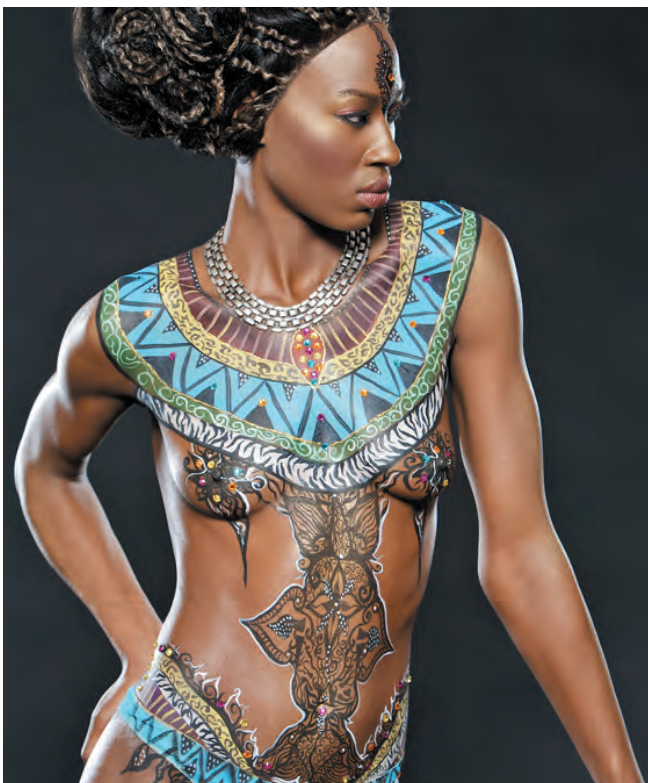
Body painting réalisé pour la marque OXUS.