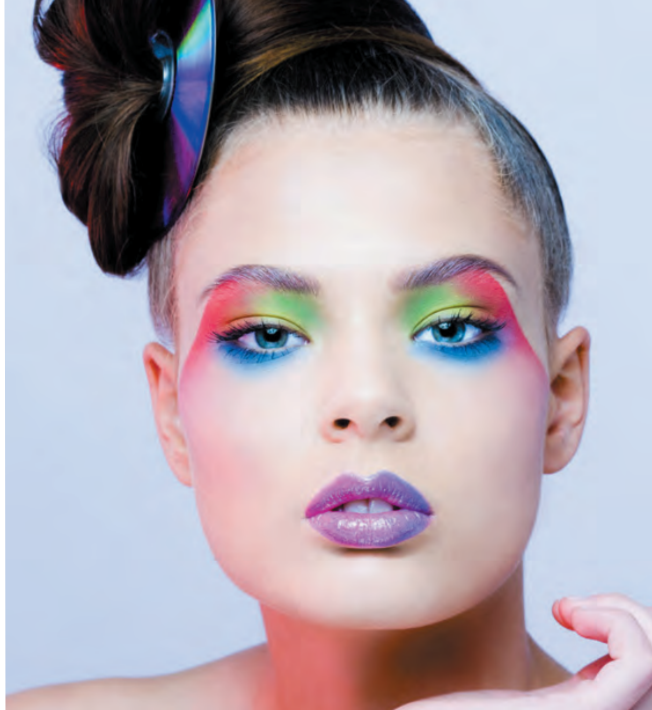
Maquillage réalisé pour TRUCCO Magazine.