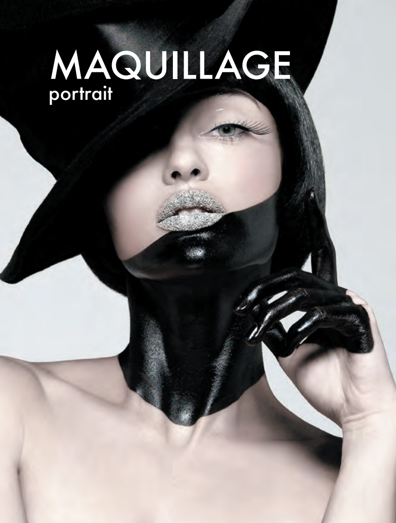
Maquillage et body painting réalisé pour Reve Magazine.