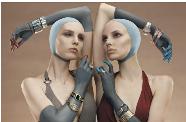
Maquillage et body painting réalisés pour Goia Magazine.